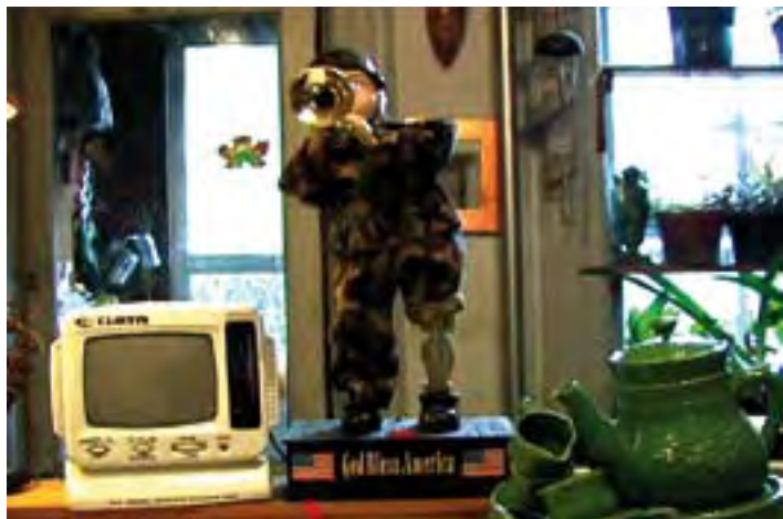
Martha Rosler, Prototype (Got Bless America) Prototipo (God Bless America), 2006. Video, 1'00". CAAM.

17:00 – 19:00 Taller Workshop Gran Canaria Espacio Digital