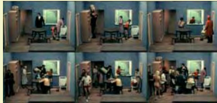
Zbigniew Rybczynski, Tango , 1980. Film, 8'14".

29 de octubre – 7 de noviembre 29 October – 7 November