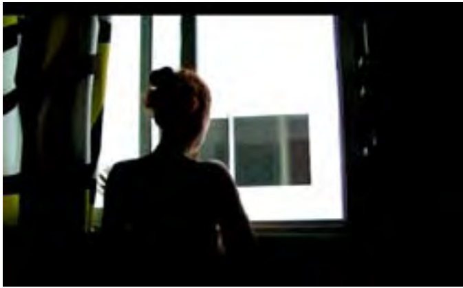
Fusionarte, Tras las ventanas Behind the Windows , 2008. Galería Saro León.

We have gone from the windows in means of transport to screen-windows (video, mobile phones, etc.). We have gone from physical windows to virtual windows. The activities seek to suggest peculiar visions and new perspectives with regard to the theme that runs through this year's Canariasmediafest: the window, the gaze through the window, the window as interface between the private world and external reality.