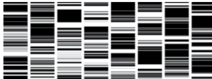
Ryoji Ikeda, test pattern [live set] . © Ikeda

Última obra audiovisual de la serie datamatics de Ikeda, en la que convierte en tiempo real los patrones de la señal de audio en patrones de códigos de barra proyectados The latest audiovisual work of Ikeda's datamatics series converts in real time audio signal patterns into synchronised barcode patterns on screen.