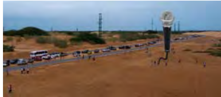
Escoitar, Sonosfera Las Palmas . Audioacción Audio-performance

Sala de formación Training room (previa inscripción registration required)