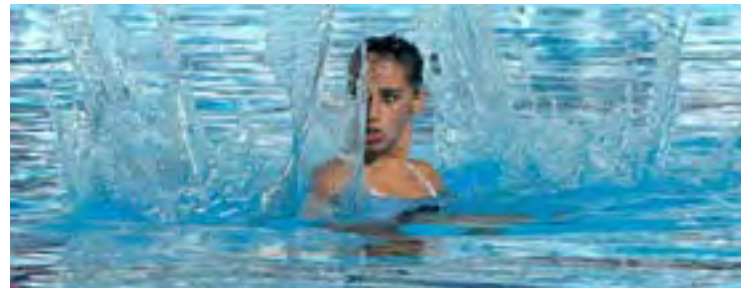
Yaiza Socorro, Sin título Untitled , 2007. Fundación Mapfre Guanarteme.

— Sección a concurso Competition section