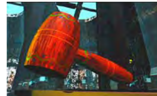
Jordi Moragues, The Hit , 1994. Animación, 3'28". © J. Moragues

21:30 Clausura Closing Ceremony SIT, Sala Insular de Teatro Performance